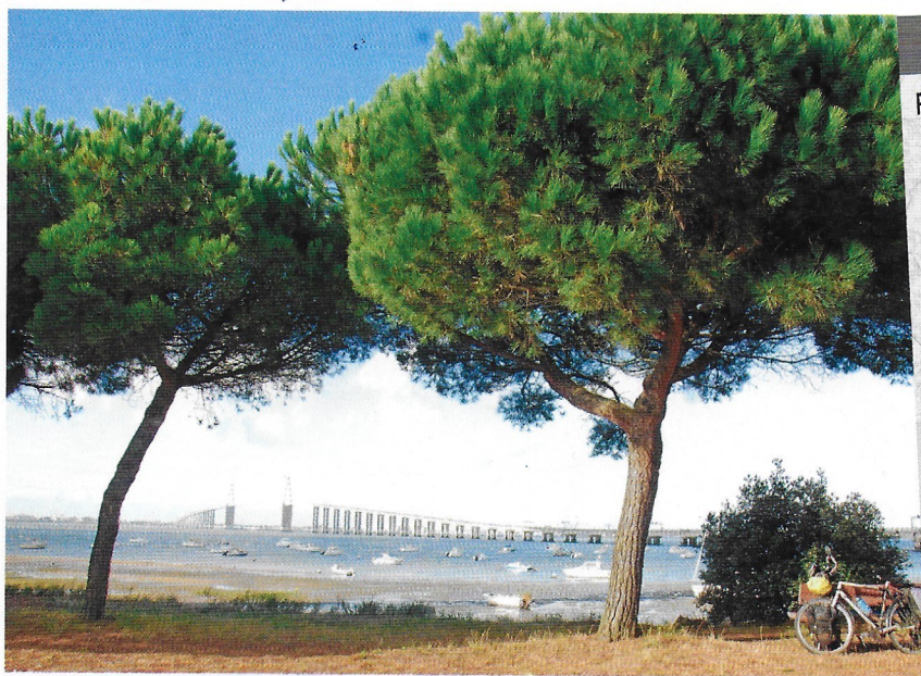
Vue sur le pont de Saint-Nazaire depuis Saint-Brévin-les-Pins.

que La Roche-sur-Yon, l'ex-Napoléonville cultive également le culte de l'Empereur via un parcours pédestre. Le canal, avec son office de tourisme installé sur une péniche, partage la ville en deux. Au sud, le centre-ville napoléonien, avec l'ancienne place d'armes, le lycée impérial et le quartier aux rues à angles droits. Côté nord, avec son imposant château des Rohan, la cité vaut aussi par ses vieux quartiers et ses maisons à pans de bois colorés.