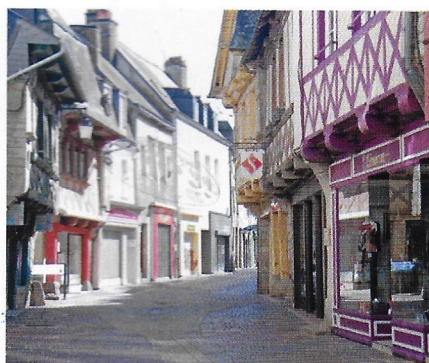
Les vieux quartiers de Pontivy.