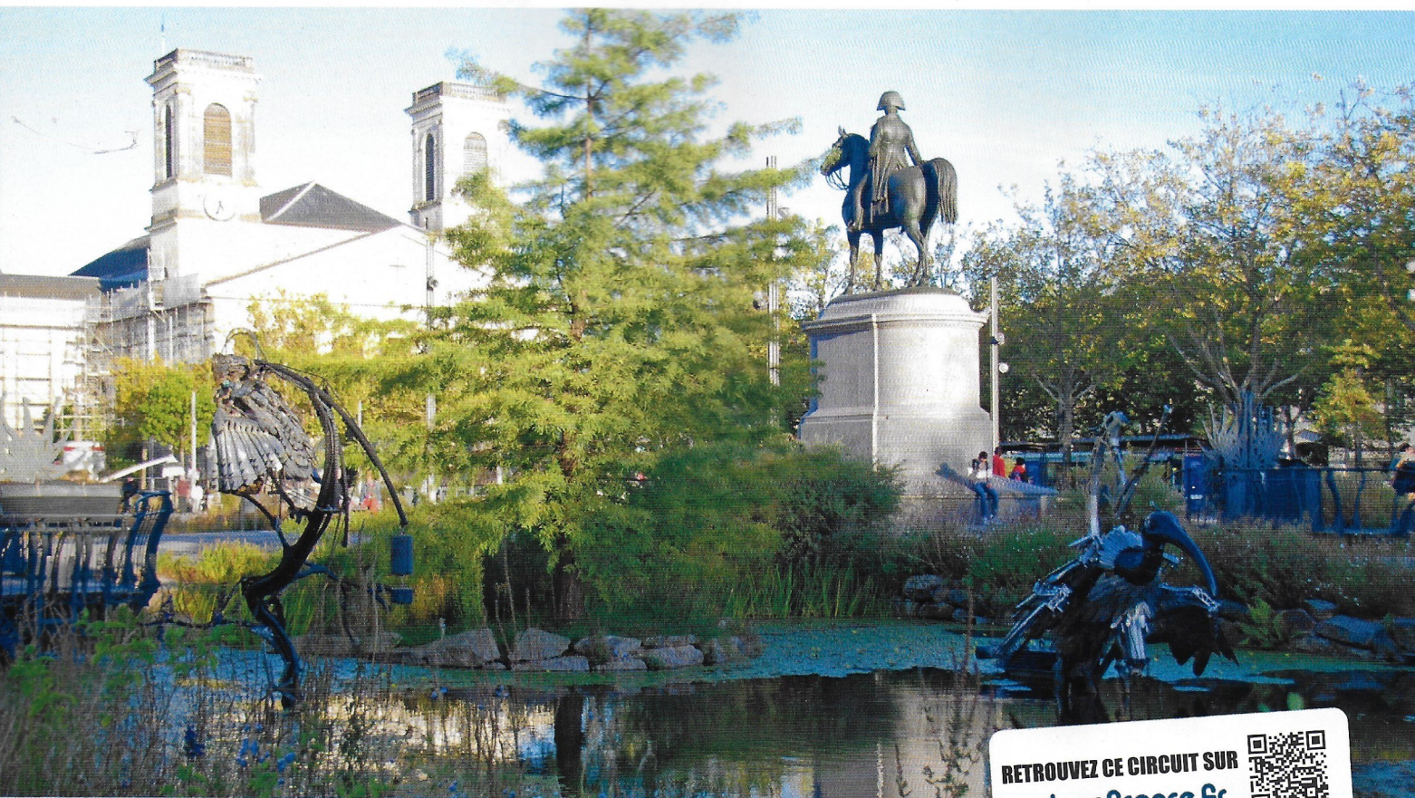
Bestiaire d'animaux d'acier sur la place Napoléon à La Roche-sur-Yon.

RETROUVEZ CE CIRCUIT SUR veloenfrance.fr